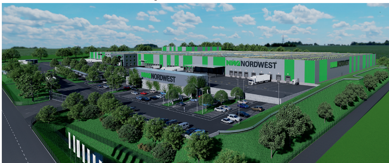
Voici à quoi ressemblera le nouveau centre logistique de NORDWEST à Alsfeld.

NORDWEST exploite l' activité de stockage en son nom propre et pour son propre compte. Pour l'heure, les marchandises commandées par le partenaire commercial sont expédiées directement depuis l'entrepôt central de Giessen, mais elles le seront bientôt depuis notre nouveau centre logistique d'Alsfeld. L'entrepôt central NORDWEST distribue également ses propres importations et les marques exclusives TECWERK et delphis. Les commandes peuvent être passées 24 heures sur 24, la livraison a généralement lieu le lendemain.